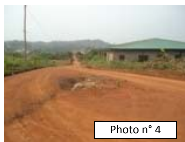
Réhabilitation de la piste première entrée après le pont-Entrée avant Elite School Carrefour Ngoume (18/12/12) : Rigoles creusées, latérite posée sur l'assiette