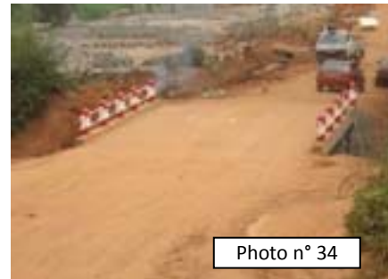
Photo n° 34

Travaux d'aménagement du tronçon de route Carrefour Camp Sonel OYOMABANG-NKOLAFEME (18/12/12) : Coulage des caniveaux en cours