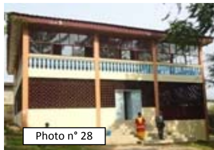
Photo n° 28