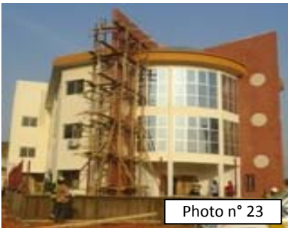
Photo n° 23