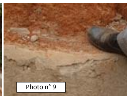
Projet d'aménagement de forte pentes (descente tabernacle du Golfe) dans les quartiers Mbankolo et Obobogo à Yaoundé (17/12/12) : Dessus des caniveaux non homogène à Mbankolo, Coulage s'effritant par endroit sur le caniveau