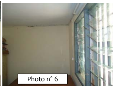
Réhabilitation CSPLI (07/08/12) : Peinture renouvelée, Chéneaux recouverts d'un isolant, Caniveaux en cours.