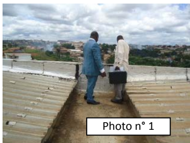
DDEFOP du Mfoundi à Yaoundé : Réhabilitation des locaux (14/08/12) : Carreaux non encore posés dans un bureau