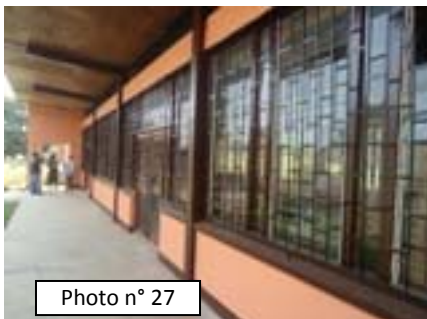
Photo n° 27