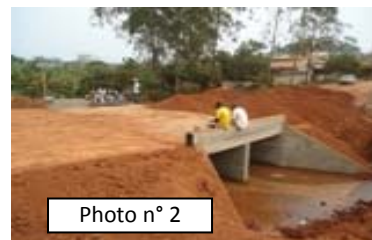
Réhabilitation de pont sur le tronçon Dispensaire Messassi-Nyom 1 (18/12/12) : Dallot bicouche réalisé, Remblage et compactage en cours