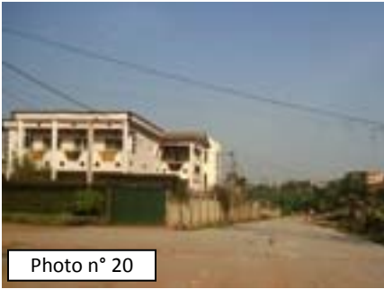
Photo n° 20 Réhabilitation d'un tronçon de route au quartier MFADENA – Yaoundé (19/09/12) : Caniveaux coulés, gravillonnage effectué